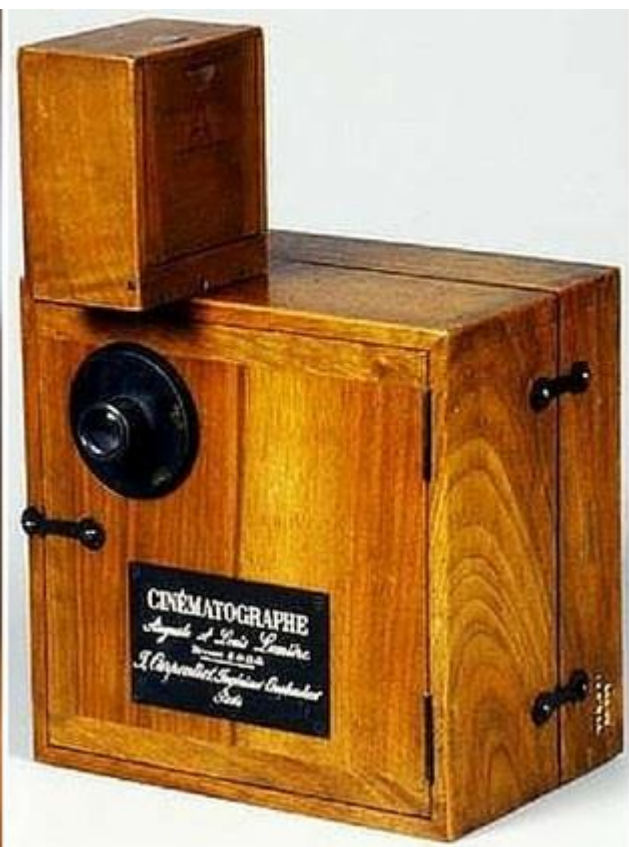
O cinematógrafo criado pelos irmãos Lumière foi patenteado em 13 de fevereiro de 1895