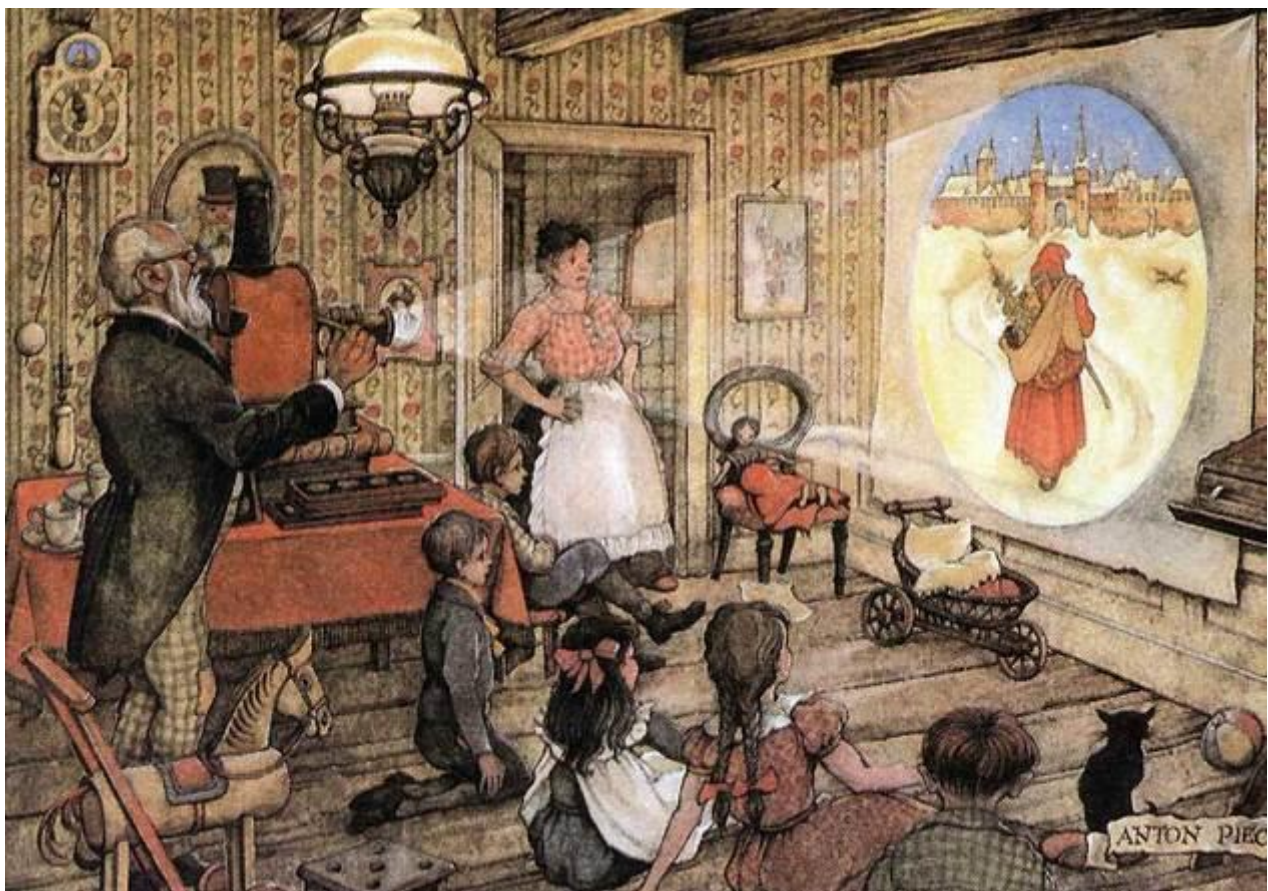
Uma apresentação doméstica de lanterna mágica para crianças