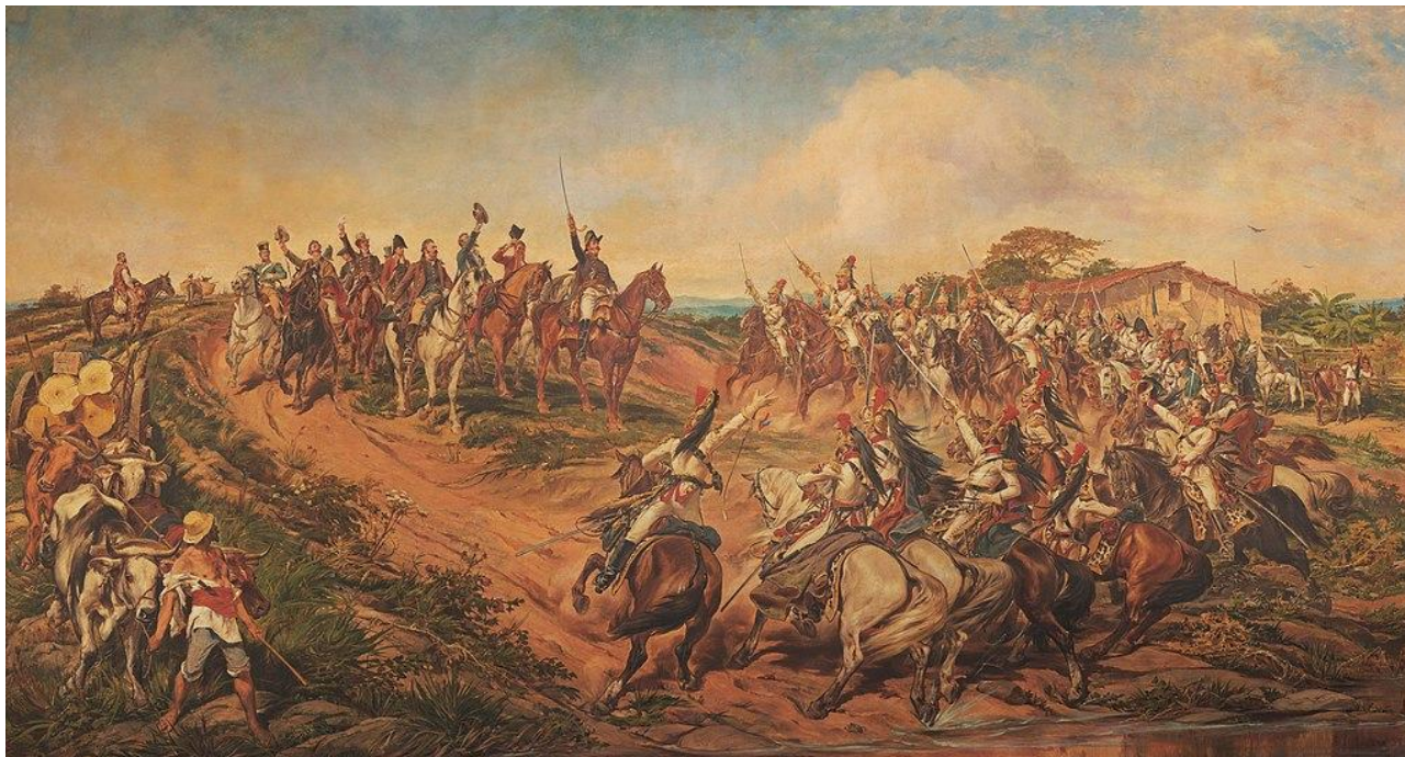
Independência ou Morte, por Pedro Américo, óleo sobre tela, 1888. Exposta no Museu Paulista.