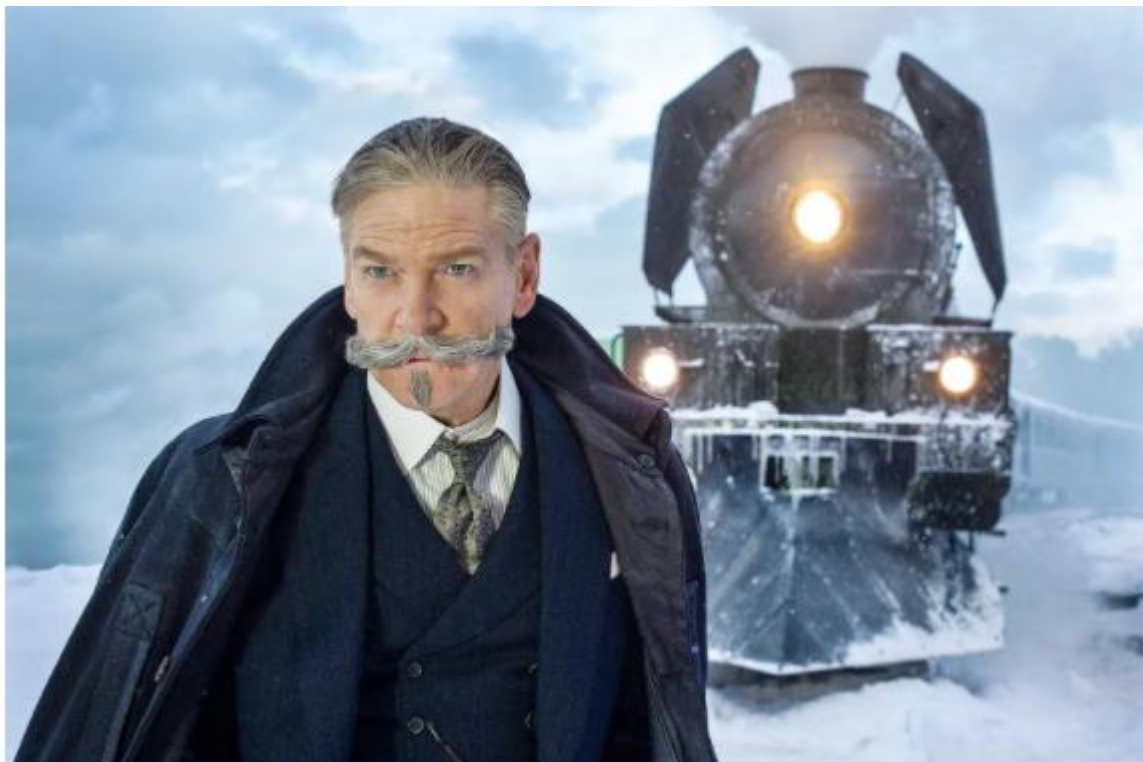
BIGODÃO – Kenneth Branagh, como Poirot: detetive imortal.

Quando a polícia encontrou seu carro vazio batido contra uma árvore, na zona rural da Inglaterra, Agatha Christie foi dada como desaparecida. O veículo estava registrado no nome do primeiro marido da escritora, que, naquele ano de 1926, havia lançado seu maior sucesso até então, O Assassinato de Roger Ackroyd. Dez dias depois do acidente, porém, ela reapareceria em circunstâncias bizarras: estava hospedada em um hotel de luxo sob o nome da jovem amante do marido. Biógrafos oficiais afirmam que a autora foi acometida de um stress pós-traumático ao descobrir que o cônjuge tinha outra. Mas, para as más línguas, tudo não passou de um golpe de marketing. Na prática, a história permanece como um dos mistérios deixados pela “rainha do crime”. Aos 36 anos, ela emergiria do episódio com garra renovada: após recusar os bens do ex infiel, assumiu a tarefa de sustentar a única filha, Rosalind, com os próprios recursos.